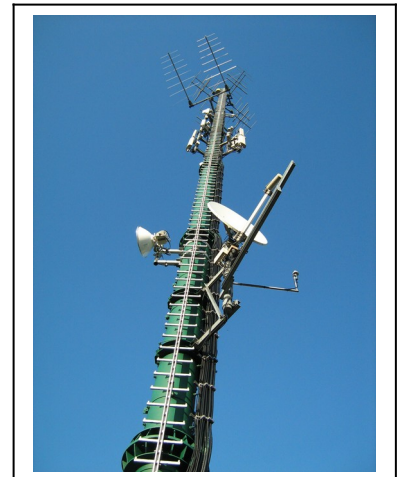
Funkmast am Poppenberg in Brilon

Zierenberg [106,5] Züschen (Fritzlar) [106,5] Züschen (Winterberg) 106,5